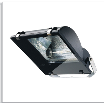
Tempo 3 MWF/SWF330 area flood-lighting luminaire with symmetric or asymmetric optic